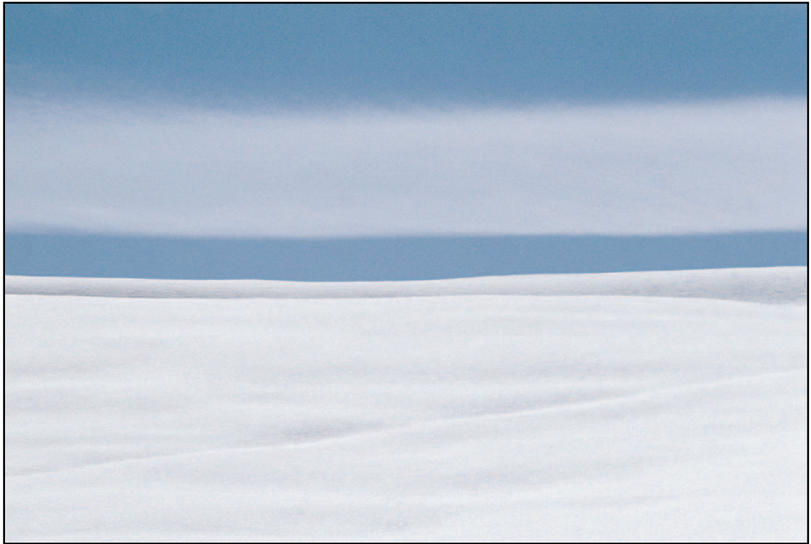
Spazio bianco Franco Fontana - Cortina - 1990