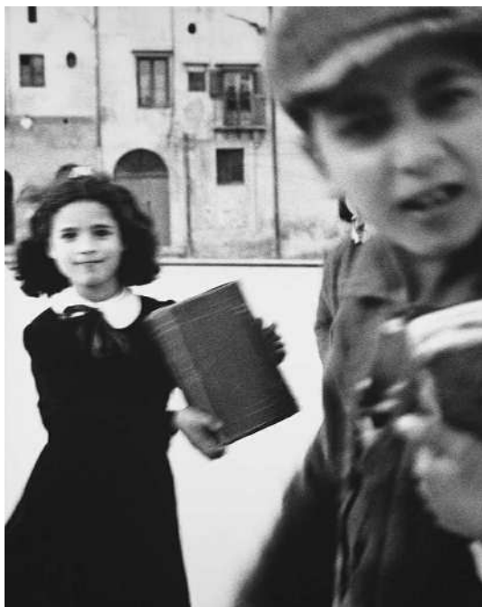
Richard Avedon - Italia #2 - Trastevere, Roma, 24 Luglio 1946 - Richard Avedon © 2008 the Richard Avedon Foundation

scrutava paziente in attesa che arrivasse il momento giusto per scattare. Grandi big del mondo dello spettacolo