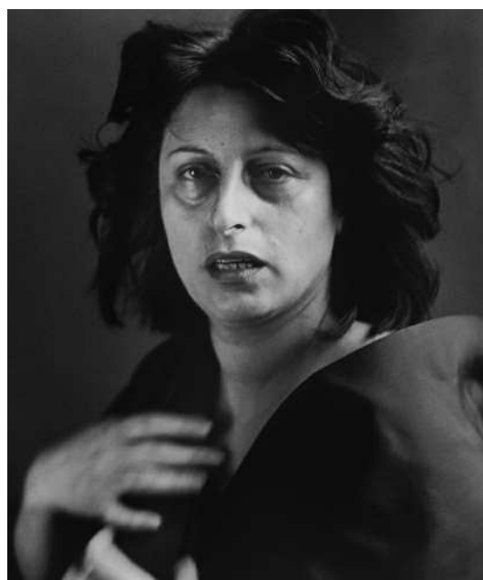
Richard Avedon - L'attrice Anna Magnani - New York, 17 Aprile 1953

quali Katherine Hepburn, Humphrey Bogart, Brigitte Bardot, Audrey Hepburn, Marilyn Monroe o ancora Buster Keaton e Charles Chaplin, o personalità del calibro di Karen Blixen, Truman Capote, Henry Kissinger, Dwight D. Eisenhower,