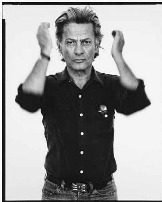
Richard Avedon - autoritratto - Provo, Utah, 20 Agosto 1980 - Richard Avedon