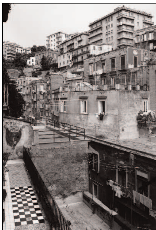
Thomas Struth - Vico dei monti -Napoli 1988

mo, intitolati "I paradisi", sono tutte rappresentazioni create con una pulizia formale e una ricerca di equilibrio minuziosa e sotterranea. La quotidianità viene congelata in un riquadro assoluto e atemporale. Struth si serve per le sue riprese anche di comparse, curandone in prima persona posizione, espressione e gestualità.