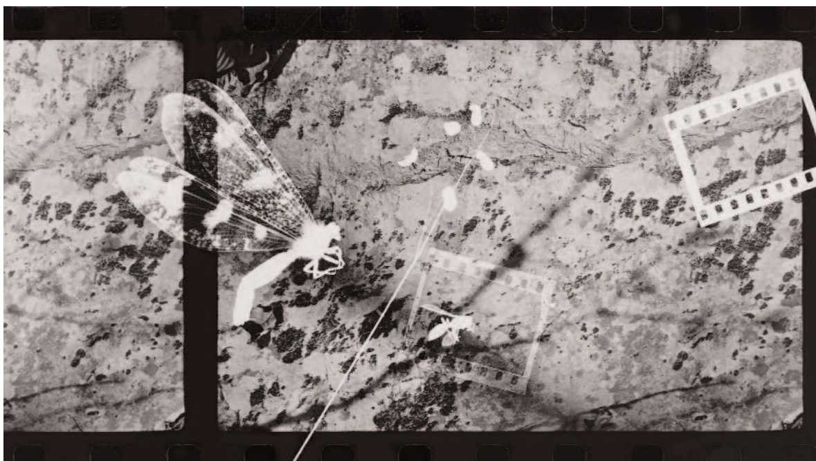
Luigi Erba - Camera chiara, camera oscura Panorama per insetti #3 (Omaggio a Bartolini) - 2007

Per informazioni: 02 784100 www.fotografiaitaliana.com