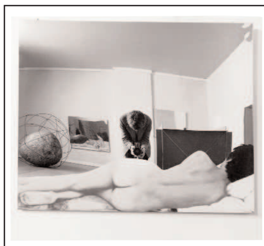
Ugo Mulas - Autoritratto di Ugo Mulas, riflesso nell'opera di Michelangelo Pistoletto, "Vitalità del negativo" - Roma, 1970 © estate Ugo Mulas Tutti i diritti riservati

Ingresso: Milano - intero 5 euro; ridotto 3/2 euro Roma - gratuito