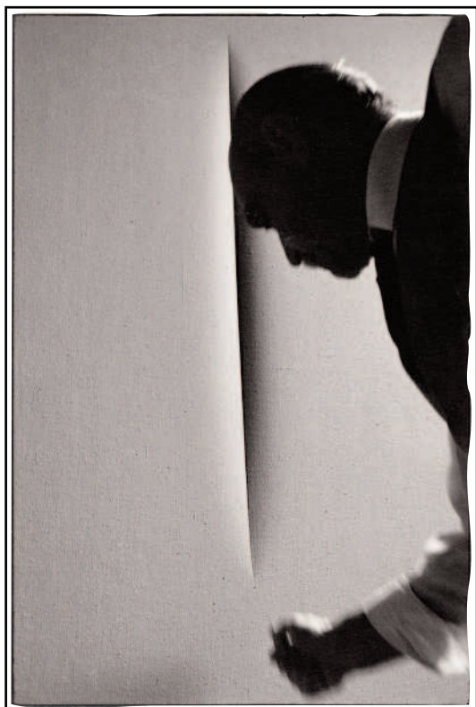
Ugo Mulas - Lucio Fontana - Milano, 1964 © estate Ugo Mulas Tutti i diritti riservati

Ugo Mulas La scena dell'arte PAC - Milano Fino al 10 febbraio MAXXI - Roma Fino al 2 marzo