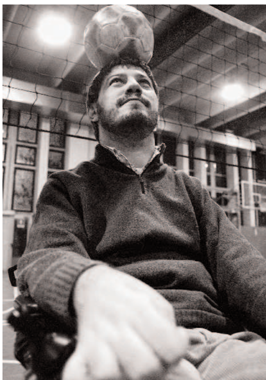
Scatti bloccati - Spazio Eventi di Milano Martina Jaider - Up

Ascanio Caracciolo, uomo appartenente alla nobiltà, si spogliò di tutti i suoi averi per intraprendere, sulla scia di San Francesco D'Assisi una vita di carità ed evangelizzazione. Le inquadrature di Spina estrapolano dai luoghi vissuti dal