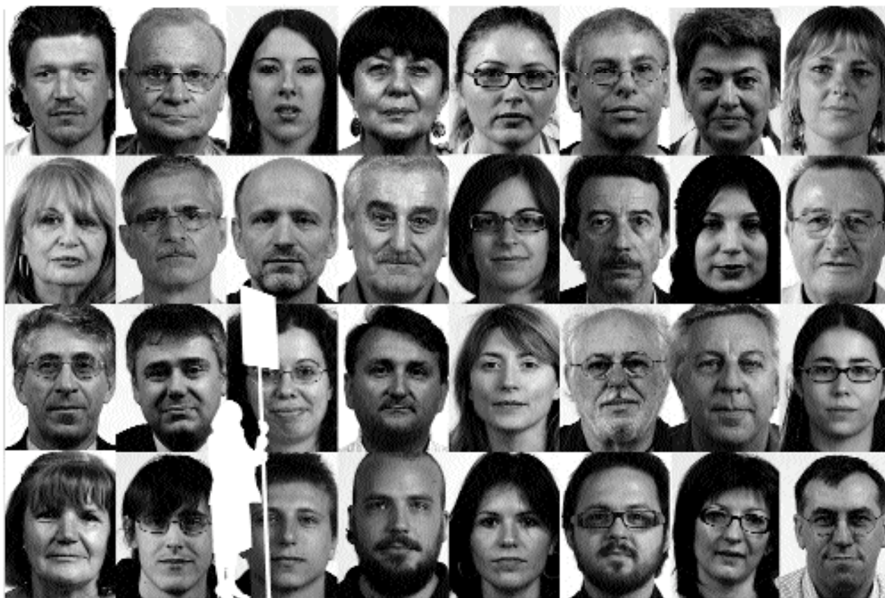
Salviamo la luna © Jochen Gerz, Cimello Galaxino - Milano 2006/2007